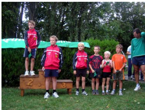
Siegerehrung Geländelauf Kinder männlich Start zum Mountainbikerennen der Schüler

Sieben von zehn Bewerben zum Hohe Wand Champion 2007 sind absolviert.