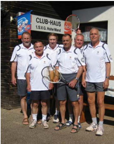
Das Seniorenteam 60+ in den neuen Tennisdressen