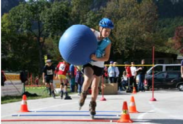
Eine entscheidende Station war diesmal das Inlineskaten

Mit fast 50 Kindern aus 7 Vereinen nahmen zwar diesmal weniger Kinder als an den Vorjahren an der Kinderolympiade 2008 teil, trotzdem war die Veranstaltung bei herrlichem Herbstwetter ein voller Erfolg.