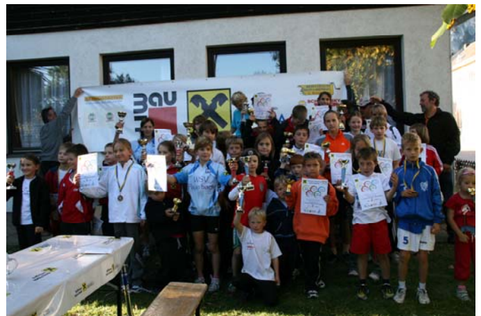
Glückliche Kinder bei der Siegerehrung

„Mit 3 Siegen, einem 2. Platz und einem 3. Platz gestaltete sich der Start unserer Kinder beim Duathlon in Neunkirchen sehr erfolgreich“