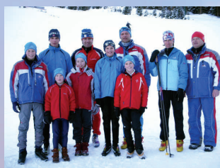
Langlauf Team NÖ Cup Rang 3