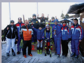
Kinder Team Gebietscup Rang 5